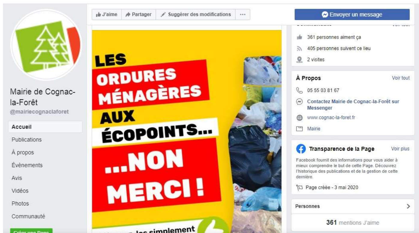
Page du Facebook de la mairie de Cognac-la-Forêt le 27 10 2021 à 12h50