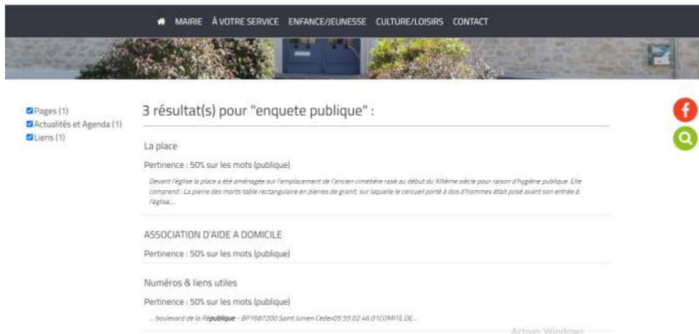
Page du site internet de la mairie de Cognac-la-Forêt le 27 10 2021 à 12h50

La mairie de Cognac-la-Forêt dispose d'un site internet, d'un Facebook. Rien n'était encore publié sur l'un de ces sites le mercredi 27 octobre.