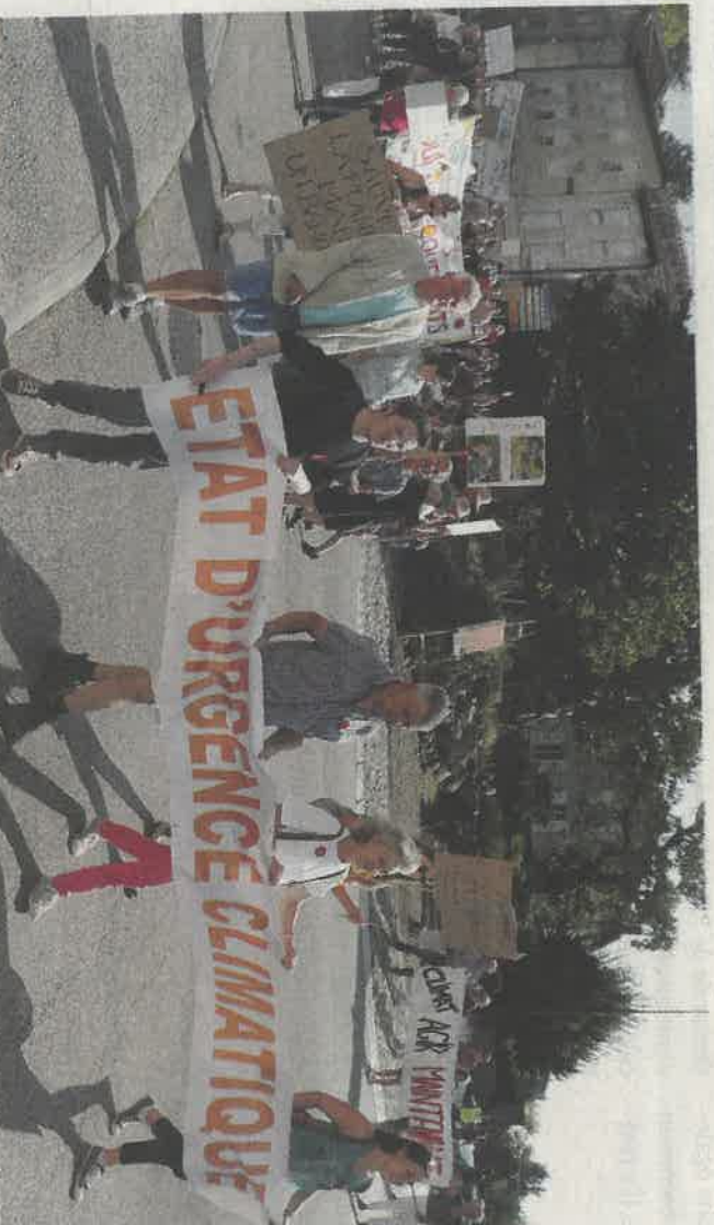
C'est l'association Saint-Junien Environnement qui organisait ce rassemblement au niveau local.

Déclinée dans la cité gantière, la Marche Mondiale pour le Climat a réuni plus de 500 personnes, le 21 septembre, pour déclarer «l'état d'urgence climatique».