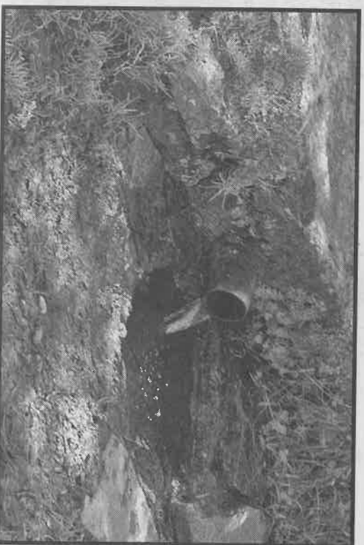
L'eau de la source à Saint Martin n'est plus potable.

LECHO HAUTE-VIENNE - 7 - Mercredi 18 septembre 2019.